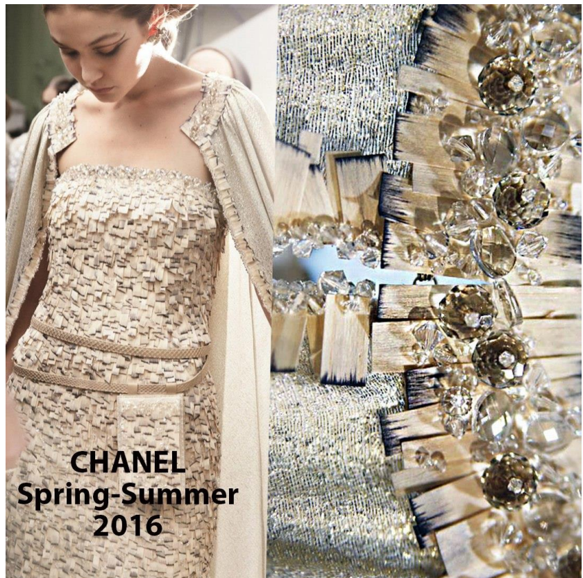
CHANEL Spring-Summer 2016