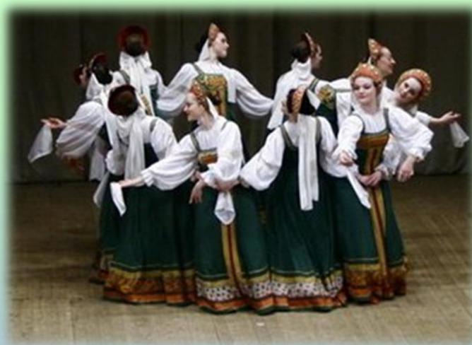
Русский хоровод «Веретёнце»