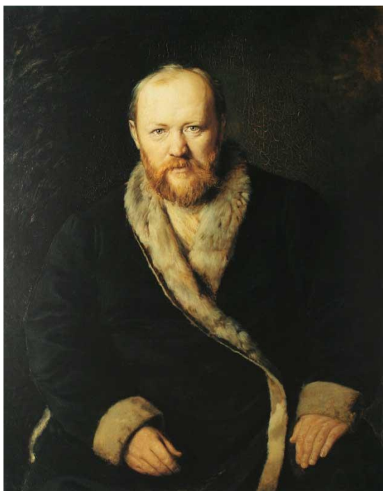
В. Перов «Портрет А. Островского»

Рассмотрите портреты знаменитых художников давних лет.