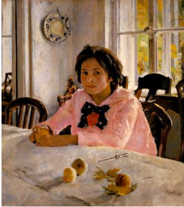
В. Серов «Девочка с персиками»