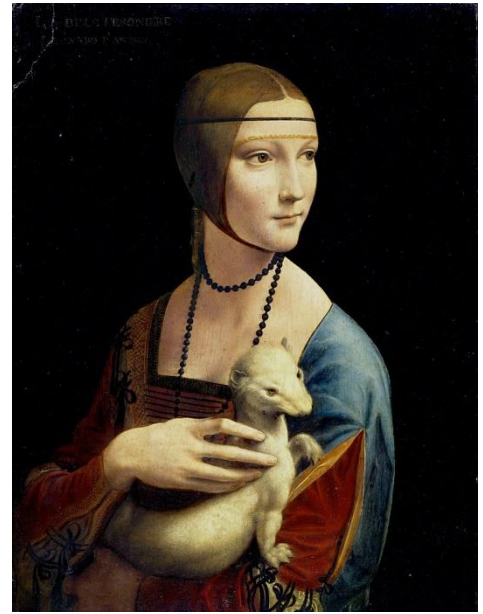
Леонардо Да Винчи «Джоконда»