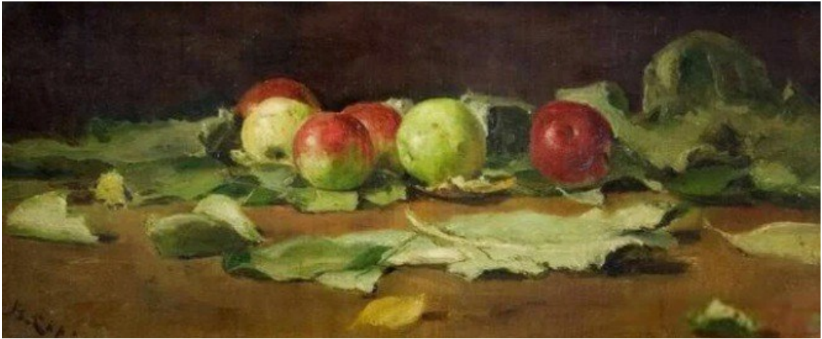
(В. Серов. «Яблоки и листья» 1879г.)