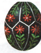
Деление на 4-х сферических четырехугольника