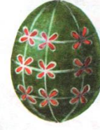
Одновременное деление «меридианами» и «широтами»