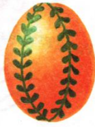
Деление вдоль двумя «меридианами»