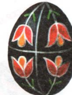
Деление пополам вдоль и поперек