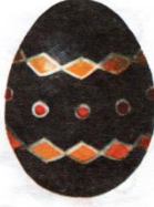
Деление в широтном направлении на несколько поясов