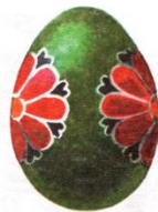
Деление вдоль пополам (один «меридиан»)