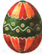
Деление поперек пополам