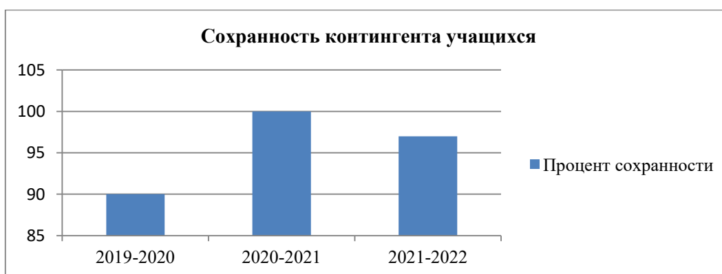
Диаграмма № 2. Сохранность контингента учащихся за три года (в %)

В объединении «Сундучок умельца» отмечается высокая сохранность контингента, что свидетельствует о существенной заинтересованности детей в обучении по дополнительной общеразвивающей программе.