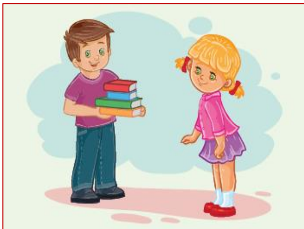
3 класс Удивительный мир