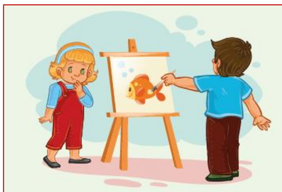
Скоро в школу