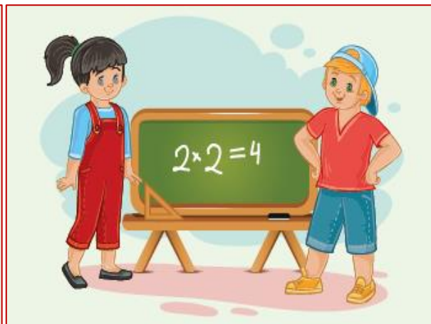
4 класс Новые открытия