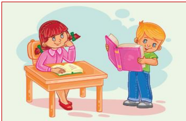
1 класс Первый звонок