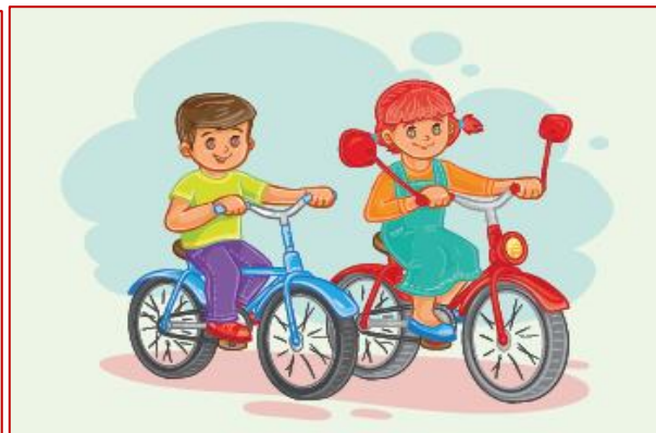
2 класс Хочу все знать