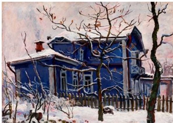
«Первый снег. Синяя дача», 1938. Кончаловский Петр Петрович

От красоты окружающей природы дети буквально замирают на месте – девочка подняла головку вверх и наблюдает за полётом снежинок. Каждому из нас, вероятно, знакомо это чувство счастья и восторга при виде первого снега, а потому картина художника близка и понятна каждому человеку, выросшему в России.